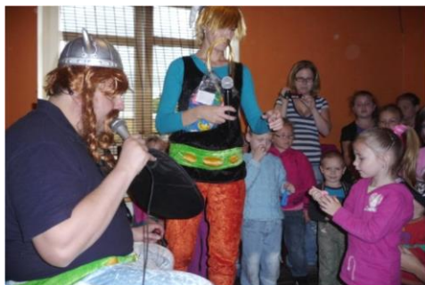
Mezinárodní den dětí