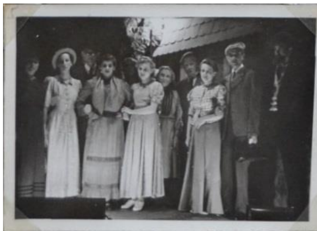
Divadelní soubor Jirásek

V současné době v obci není vyvíjena žádná spolková činnost.