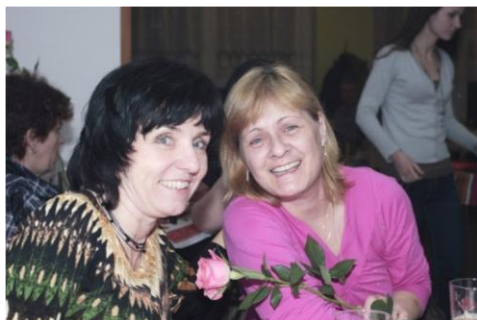
Mezinárodní den žen