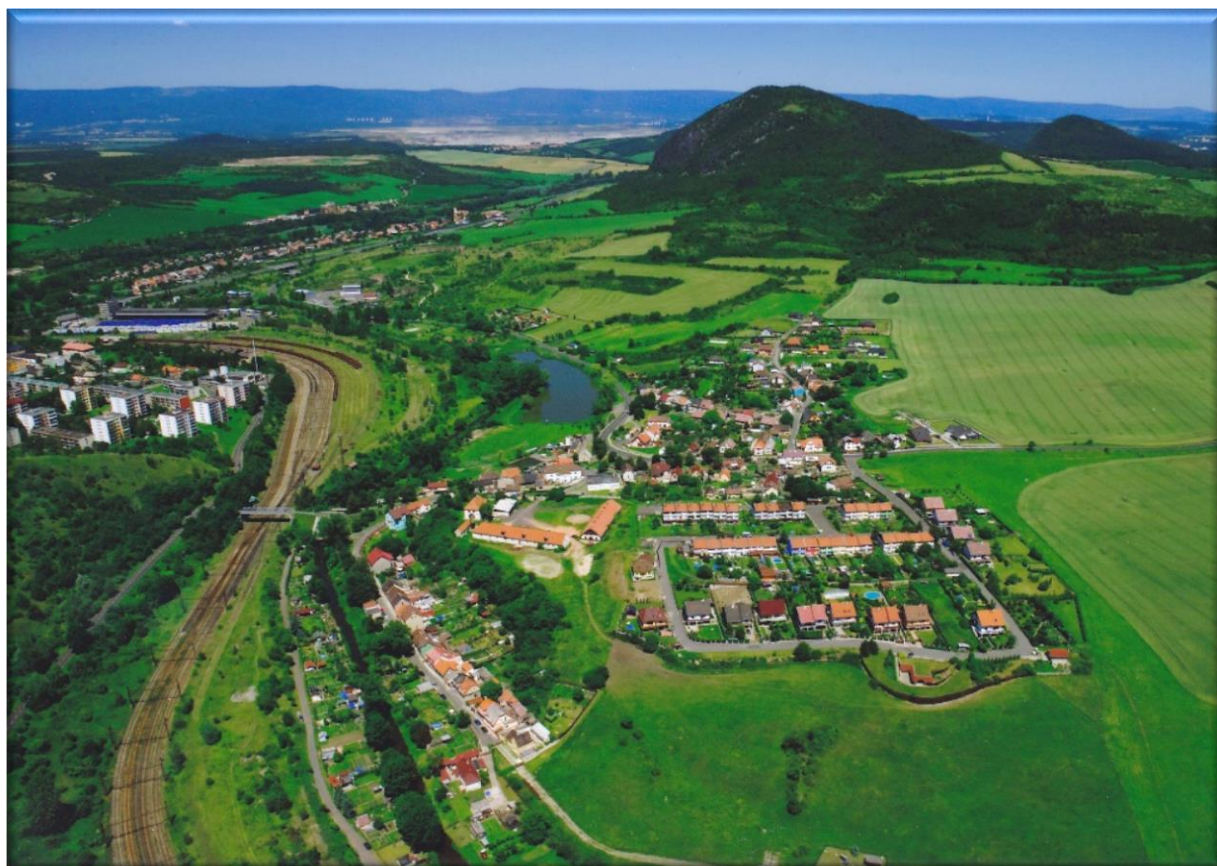
Východní pohled na obec