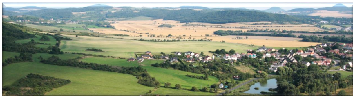
Západní pohled na obec